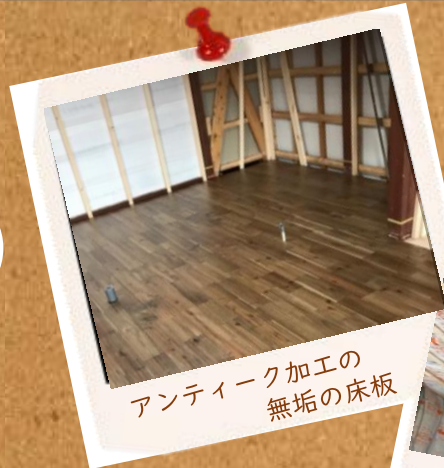
アンティーク加工の無垢の床板

リフォーム工事は順調に進んでいますよ♪ トイレや洗面所は仕上がリ 今は、リビングの床工事をしています!! 床を貼るととてもいい雰囲気になりお施主様も喜んでおられました(^o^) 暑い日が続く中、私たちの身体の事も気にかけていただき熱さまシートや冷却スプレーなどをご用意くださいました。大変有難かったです!!